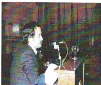
Intervención en el II Congreso. de Mutilados, en Madrid

- En estos 40 años , convivir con los Mutilados de la II República, ha sido muy gratificante, muchas jornadas juntos, recuerdo con mucho cariño la entrega que se me hizo por la Liga de Mutilados, de una Placa y Diploma , en 1987 en Toledo, el congreso organizado en Zaragoza , con el acto inaugural en el Palacio de la Aljaferia , (23-6-1989), el viaje a Cuba , con las recepciones de Raúl Castro , y del Embajador de España ,...los preparativos de Congresos en Madrid , no puedo dejar de repetir y recordar lo injusto como se les ha tratado, por el Estado (cuando han contribuido en su medida, a la llegada de la Democracia , sin revanchismos, ni odios, venganzas, ni procesos de ajustes de cuentas, (no interfiriendo nunca en las distintas opciones políticas y dejando que los Políticos hicieran su tarea ) no cejando de reivindicar sus Derechos .