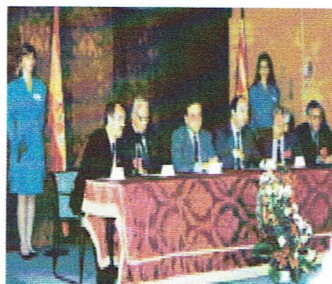
V Congreso de Mutilados en el Palacio de la Aljaferia.