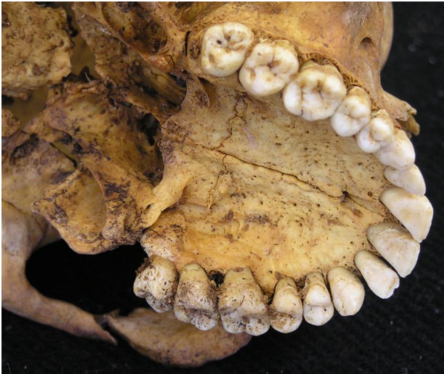
Sutura palatina.....menor de 30 años

En la 4ª y 5ª vértebras lumbares comienzan a aparecer signos incipientes de artrosis.