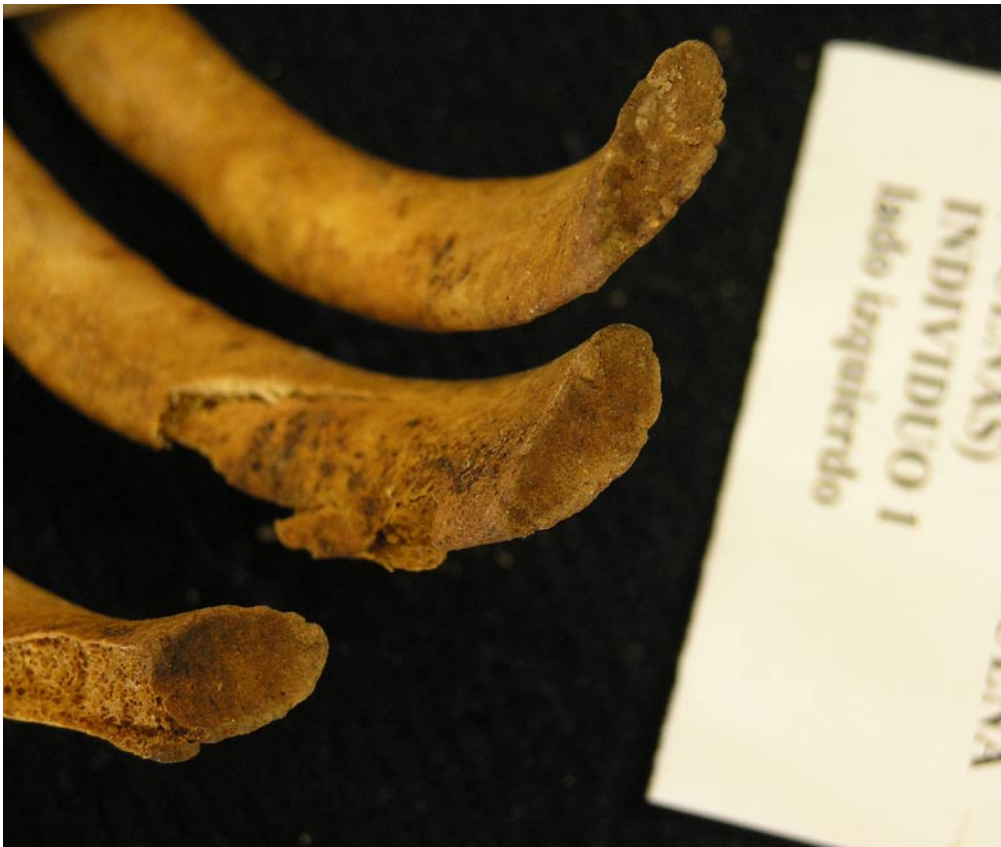
Extremidad esternal de las costillas: 20... 29 años.