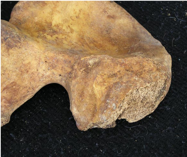
Superficie auricular 25---29 años.