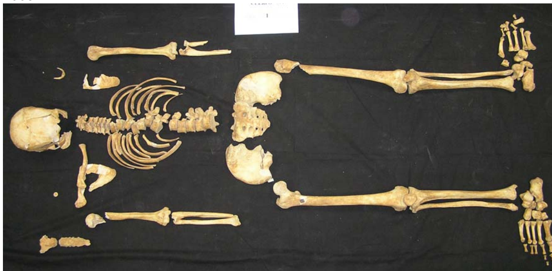
Restos del individuo n° 1 después de limpio y reconstruido en lo posible.

El individuo n° 1 fue muy afectado por la prospección que realizamos en octubre de 2008