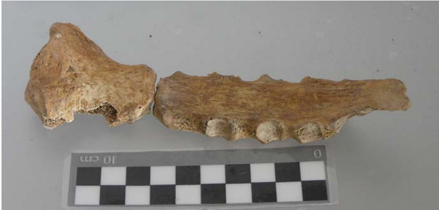
Esternón: separado manubrio y cuerpo, con el cuerpo incurvado en la zona del ápex.