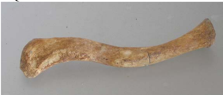
Clavícula derecha con fractura postmortem.