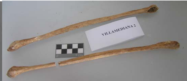
Peroné derecho con fractura postmortem.

Los parámetros antropométricos son los siguientes: