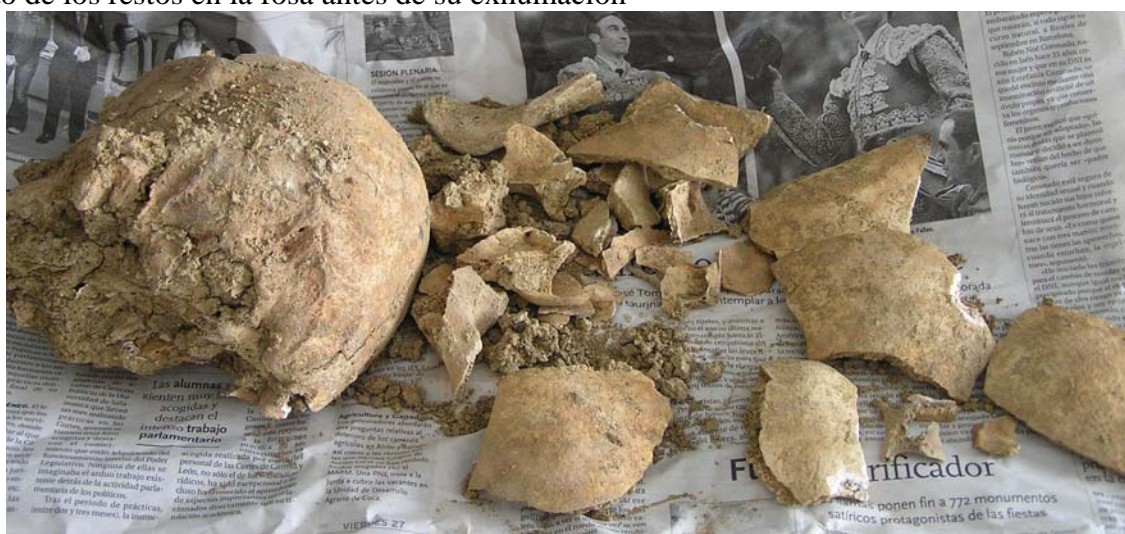
Restos del cráneo antes de su limpieza y reconstrucción