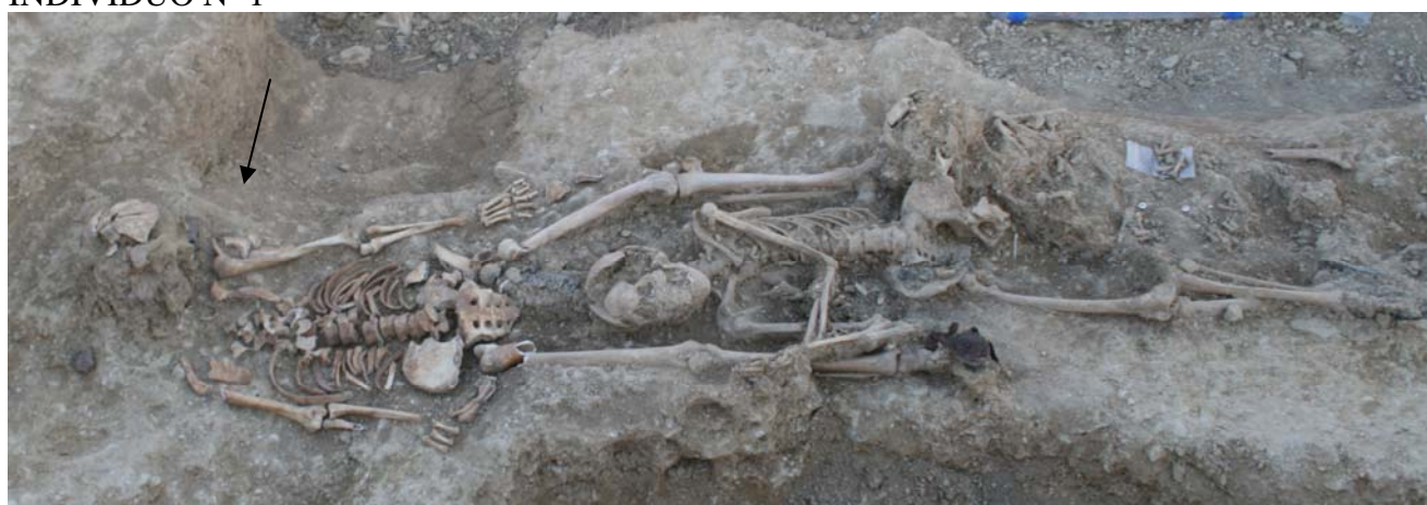
Aspecto de los restos en la fosa antes de su exhumación