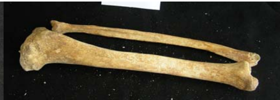
Tibias derecha e izquierda sin hallazgos y ambos peronés completos