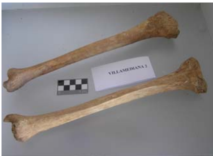
Tibias sin hallazgos.