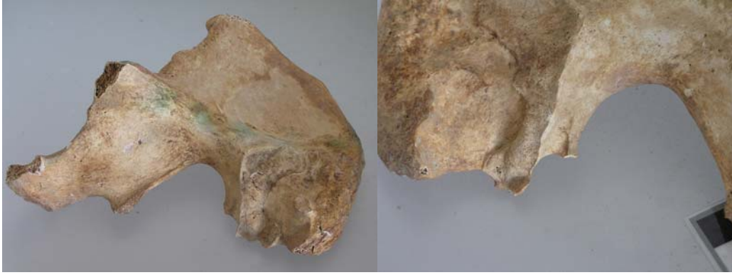
Iliacos con características femeninas y a los que falta el pubis, alteración ocurrida en el postmortem.