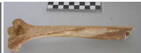
Humero derecho incompleto mientras que el izquierdo aparece completo