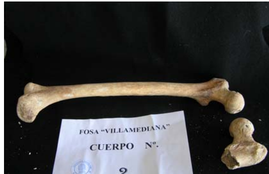
Fémur derecho sin hallazgos, del fémur izquierdo solo se recupera el extremo proximal, el resto desapareció en la exhumación anterior.