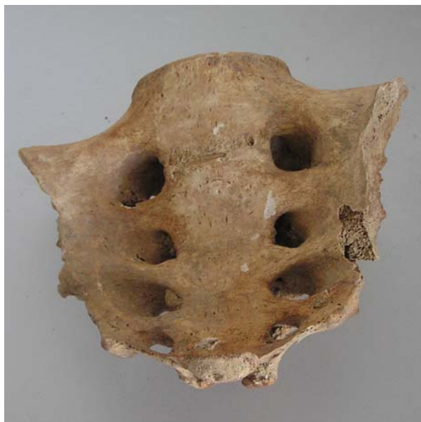
Sacro de características femeninas