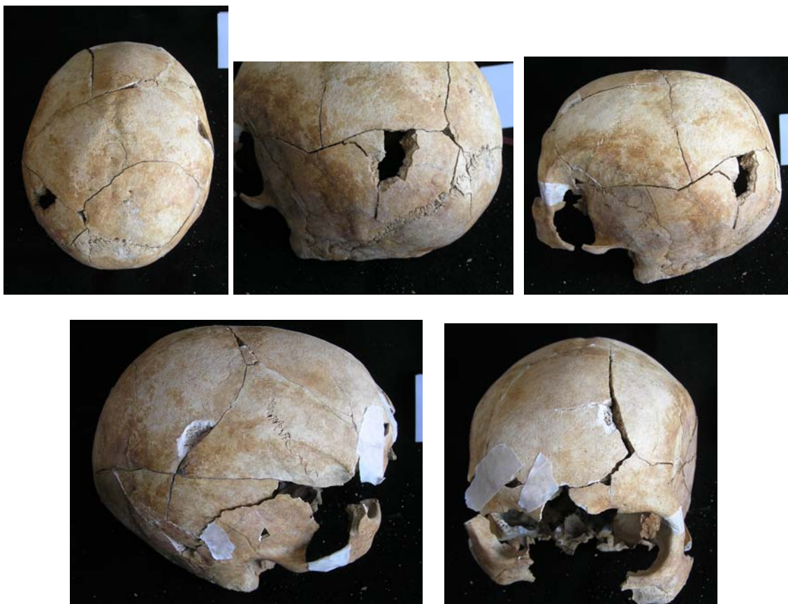
Cráneo una vez limpio y reconstruido en lo posible.