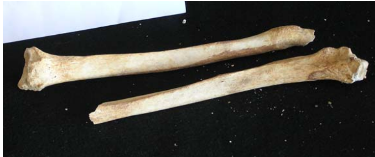
Cúbito y radio de ambos lados incompletos