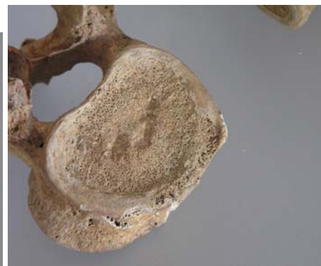
Nódulos de Smoll en cuerpo vertebral.