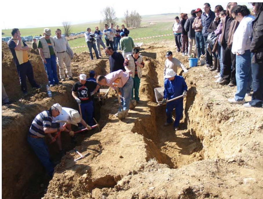
INDIVIDUO N° 1