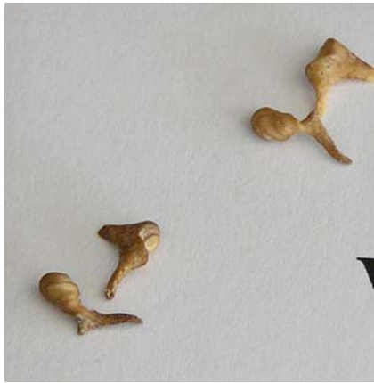
Yunque y martillo de 4 ambos oídos