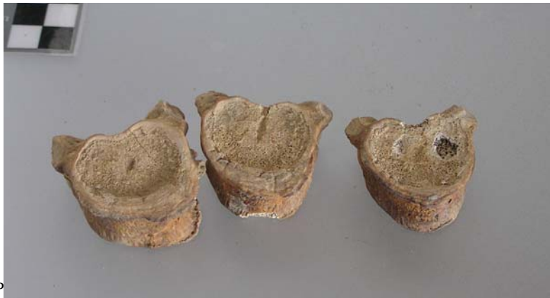
Columna vertebral: Falta el atlas y varias vértebras dorsales que por otra parte aparecen muy deterioradas por efecto de la pala durante la prospección.